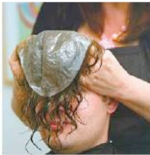
6 Se coloca la membrana, la cual es de cabello natural y permite la sudoración normal.