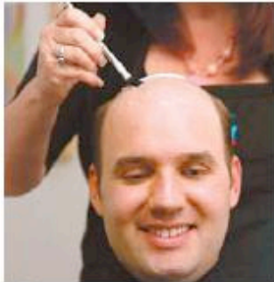
3 Ya elegida la membrana con el pelo, se marcan -con color blanco- las zonas límites.