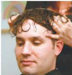
7 Es fundamental realizar algunos ajustes de la membrana para que quede perfecta.