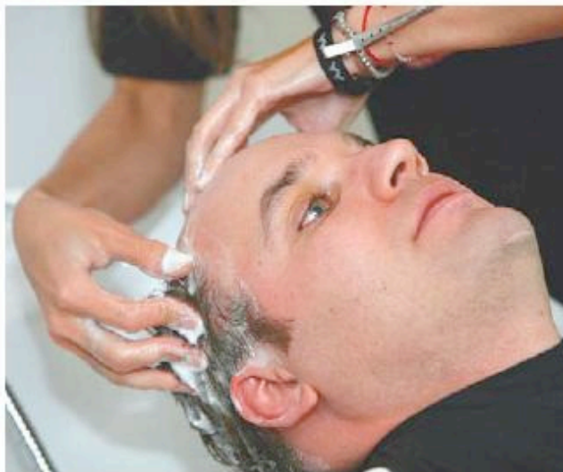
1 El primer paso es lavar el cabello a la persona a fin de quitar impurezas.

60% de los varones en México y 5% de las mujeres padecen alopecia, mejor conocida como calvicie