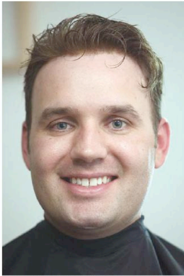
8 El pegamento se seca en un minuto y comienza el corte de pelo. La persona queda lista, con una cabellera muy natural.